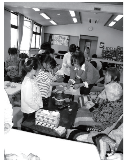
▲地域住民が講師となり、利用者と子どもたちが折り紙を楽しむ様子

このように「ゆうゆうライフ」では、地域住民と話し合う中から利用者の社会参加や活動の場をつくっています。