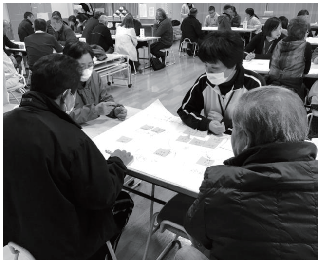
▲地区に出向いて介護・相談職員と住民が一緒に話し合う

また、今年度は、「防災と福祉の連携促進モデル事業」（県事業）の実施を受け、ある集落において、ケアマネジャーと地域福祉担当職員、行政職員が地域住民と話し合いを重ねました。その結果、災害時を想定したケアプランの作成のみならず、地域の防災計画づくりにもつながり、地域の力をみんなで実感する機会となりました。